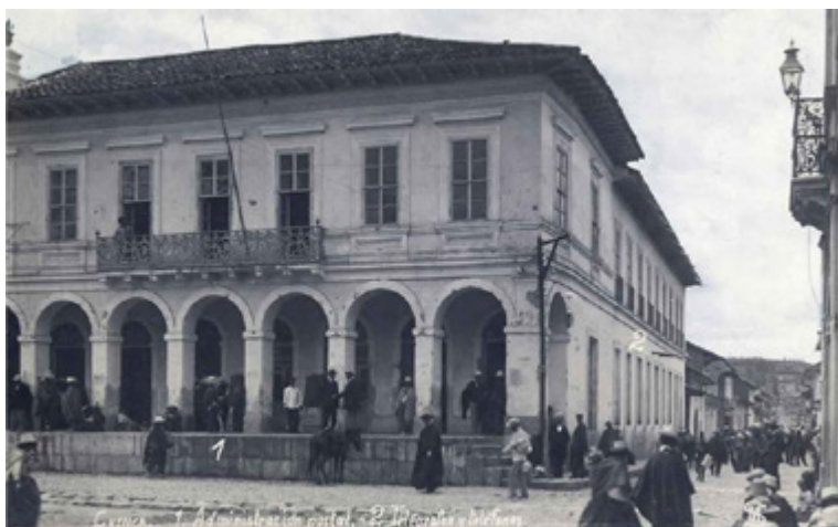
Figura 4. Antigua Gobernación del Azuay, 1922. Díaz, 2009.

La especulación del suelo aumentó y dejó a su paso las consecuentes secuelas del desarrollo, como la sustitución de las viejas casonas cuencanas por edificios con expresiones formales copiadas del extranjero; el incremento de la ocupación del suelo mediante la modificación o eliminación de espacios cubiertos y/o abiertos; y la rápida densificación de las áreas periféricas que forzó a la entidad municipal a extender sus redes de servicios básicos (véanse figuras 4 y 5).