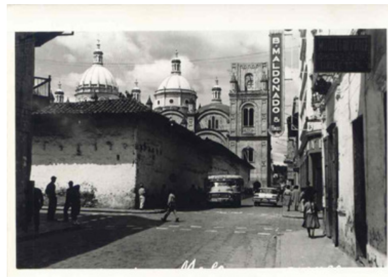
Figura 2. Convento del Carmen de la Asunción. Archivo Histórico Municipal, 1950.