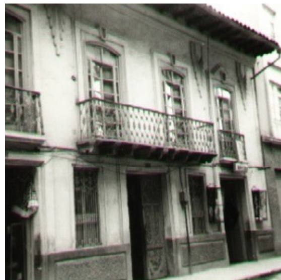
Figura 6. Tradicional casana cuencana, actualmente desaparecida. Instituto Nacional de Patrimonio Cultural, 1975.

Arquitectónico (VHIAR)— continuaron prestando especial interés a la conservación de los aspectos establecidos sobre la base del Plan de Desarrollo Urbano del Área Metropolitana de la Ciudad de Cuenca (IMC y Consulplan, 1982). Es decir, a la temporalidad; a la tipología arquitectónica determinada por el tipo de ocupación del suelo o manera en la que la edificación se emplaza en el predio; al número de patios y de pisos; a la ubicación y número de accesos; a las características formales determinadas por la composición de la portada —relación vano-macizo, simetría, portales y/o galerías— (véanse figuras 6 y 7). Pero, además, la presencia de materiales y técnicas tradicionales como muros de adobe y bahareque, revestimientos con revoques de tierra, empañete con pasta de guano y encaulado y cancelería de madera (POT, 2008a), excluyó edificaciones de la época moderna.