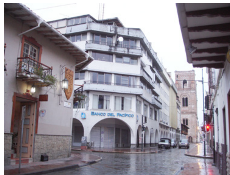
Figura 3. Actual perspectiva del extremo sur-oeste del Convento del Carmen de la Asunción. Sandra Washima Tola, 2013.