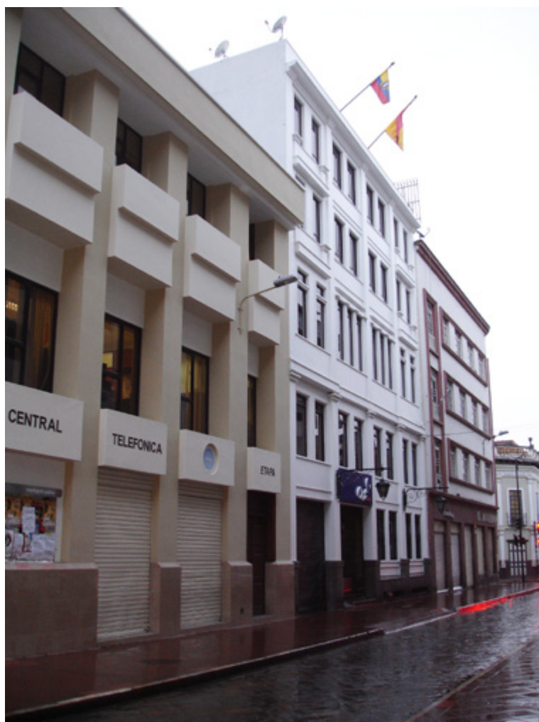
Figura 7. Actual edificación que reemplazó a la casona cuencana tradicional. Sandra Washima Tola, 2013.

El gran universo de inmuebles catalogados a inicios de la década de 1980 estuvo inmerso en las categorías VHIAR-1 y VHIAR-2 y una pequeña parte de inmuebles de arquitectura civil con la categoría de VHIAR-3 por sus características modestas o grado de alteración.