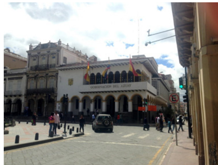
Figura 5. Actual Gobernación del Azuay, 2009.

El inventario del Patrimonio Monumental de Cuenca (INPC, 1975) desarrollado por la Dirección de Patrimonio Artístico —actual Instituto Nacional de Patrimonio Cultural (INPC)— fue el primer intento de registro de edificaciones